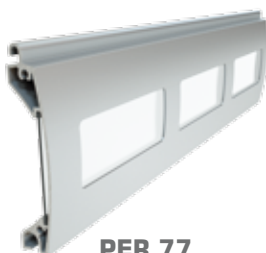
PER 77 wysokość profilu: 77 mm grubość: 18,5 mm