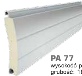
PA 77 wysokość profilu: 77 mm grubość: 18,5 mm