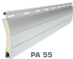
PA 55 wysokość profilu: 55 mm grubość: 14 mm