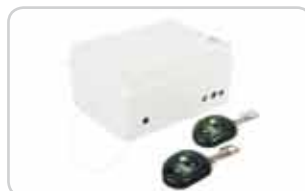
Centralki z pilotami