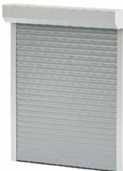
BGR / SK