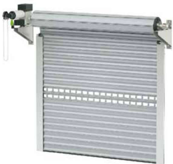
BPR / KNS