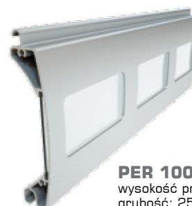
PER 100 wysokość profilu: 100 mm grubość: 25 mm