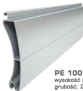
PE 100 wysokość profilu: 100 mm grubość: 25 mm