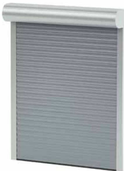
BGR / SKO-P