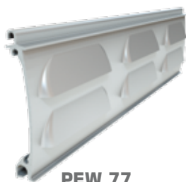
PEW 77 wysokość profilu: 77 mm grubość: 14,5 mm