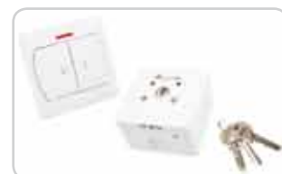
Przełączniki klawiszowe i kluczykowe